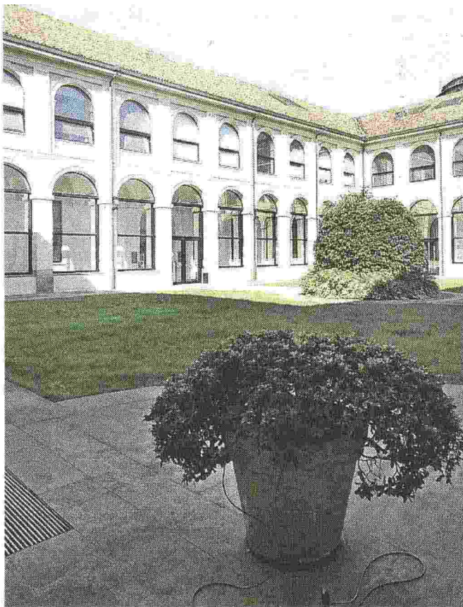
Il palazzo di corso Magenta col chiostro e il giardino interno